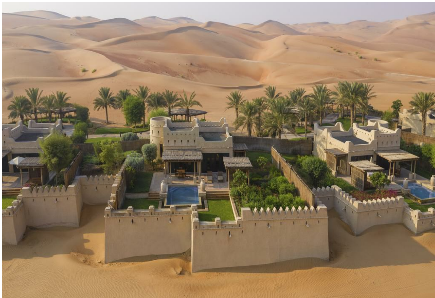
Mahdar bin Usayyan | Liwa Desert

Eine Oase der Ruhe und Erholung, die an Eleganz kaum zu überbieten ist. Ein Wellness-Paradies mit einer Atmosphäre zum Wohlfühlen.